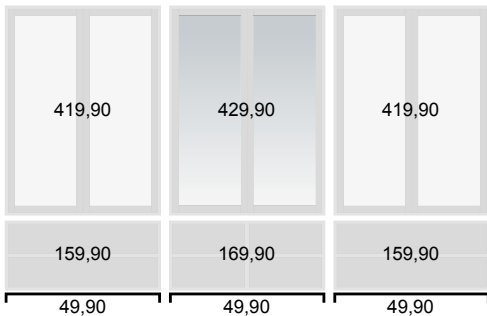
1 Schrankwand, ca. 230 x 52 x 288 cm, Modell: QHOSMST172W € 1.909,10 (Preis ohne Innenausstattung und Griffe)