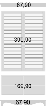
2 Lamellenschrank ca. 191,5 x 56 x 104 cm, Modell: QHOKMWLT129LS € 705,60 (Preis ohne Innenausstattung und Griffe)